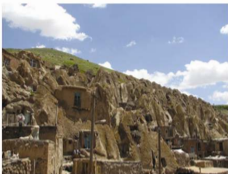
نمای دیدگاه شمال از یزد

نورانی خانه های مسخره ای که به صورت تپه های کوه نظیر کله قندی مخروطی بوده و در نوع خود منحصر به فرد است. چاشمو آتار و مناره خاص را به این روستا بخشیده است. علاوه بر معماری غالب و خاص خانه ها که از گیسو از نولندنی آسان و طبیعت است. وجود آب معدنی گورابا نیز در زیبایی های آن افزوده است. در این منطقه دو چشمه آب معدنی وجود دارد .